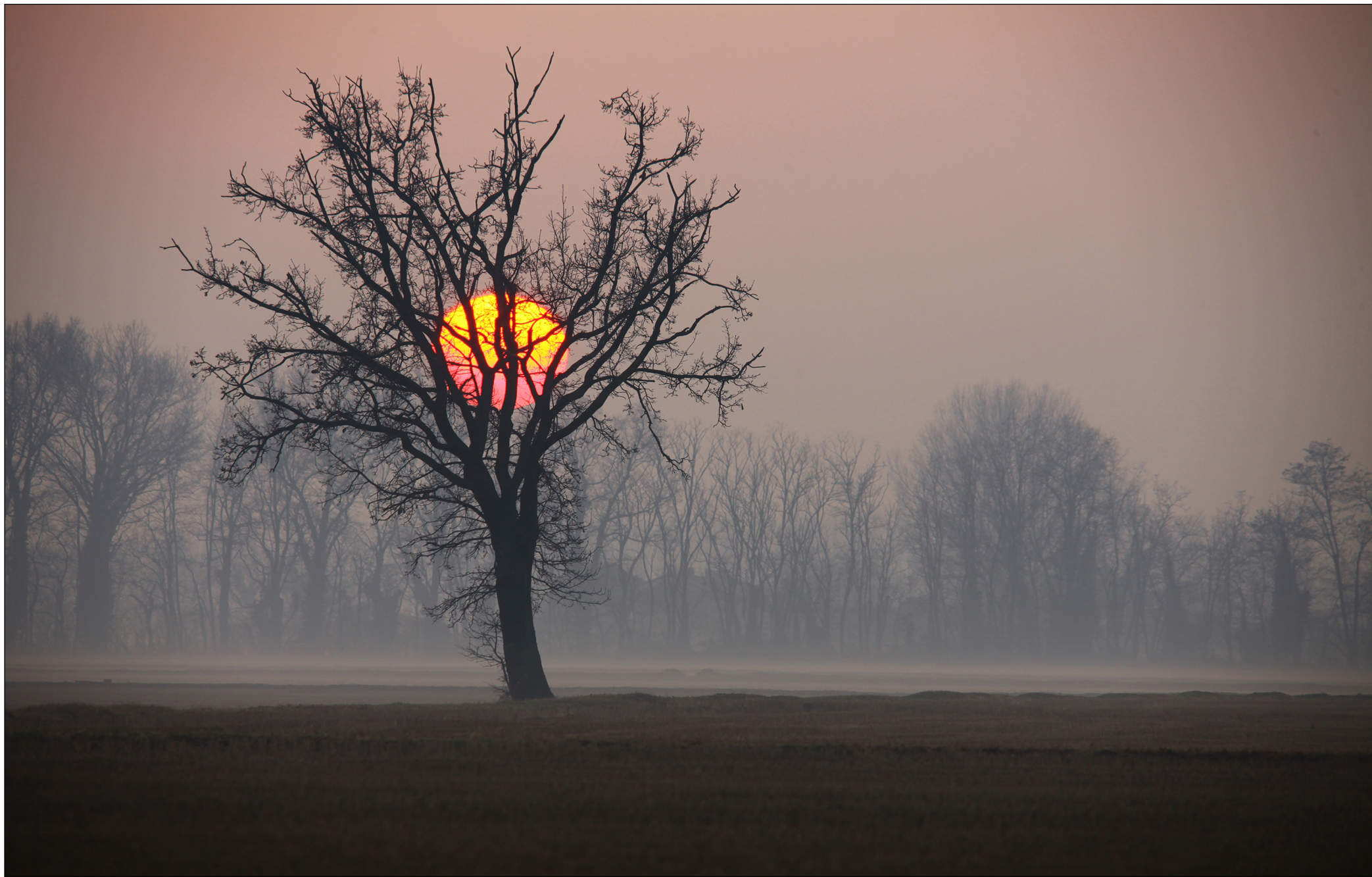
Concorso fotografico 2019 "I COLORI DEL PARCO SUD", Claudio Zucca - Dolce abbraccio