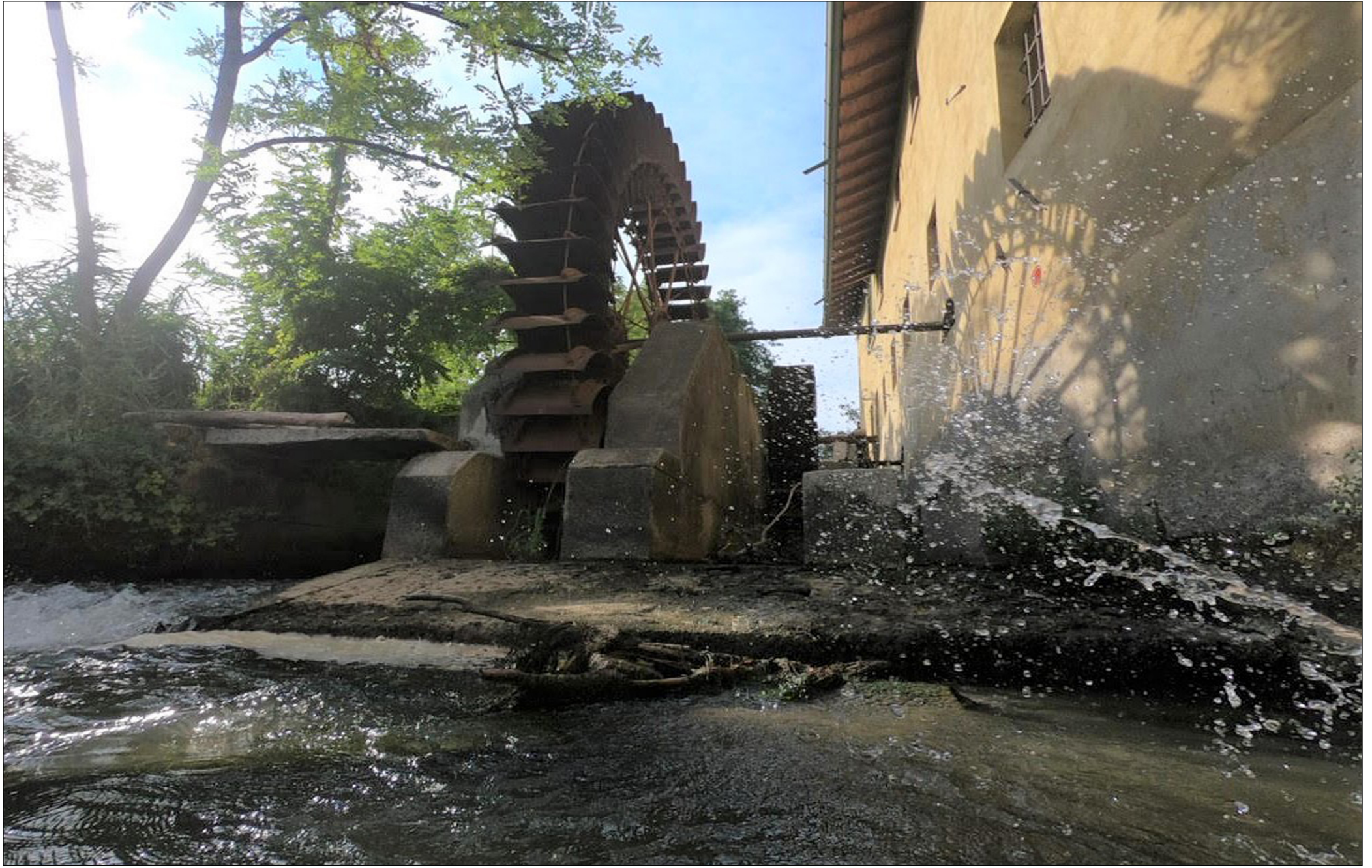
Concorso fotografico 2022 "MULINI NEL PARCO SUD", Marco Maiocchi - Moncucco, mulino piccolo 2