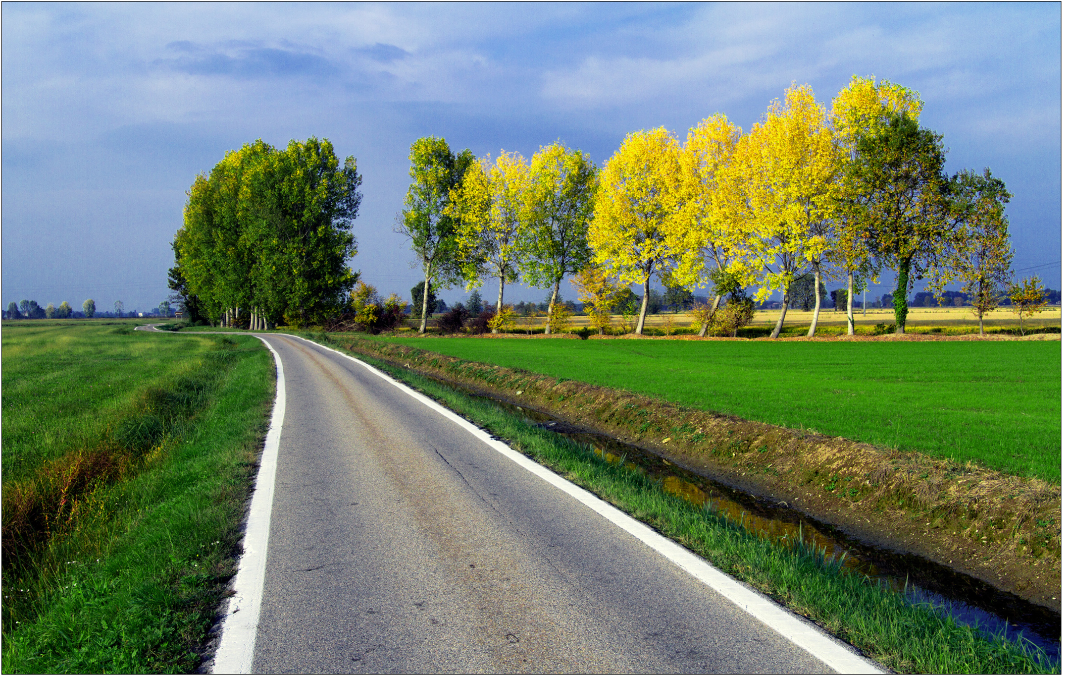
Concorso fotografico 2017 "PARCO SUD E DINTORNI: SCORCI E ANGOLI DI BELLEZZA", Giuseppe Monga - Fra le cascate Tavernasco e Femegro