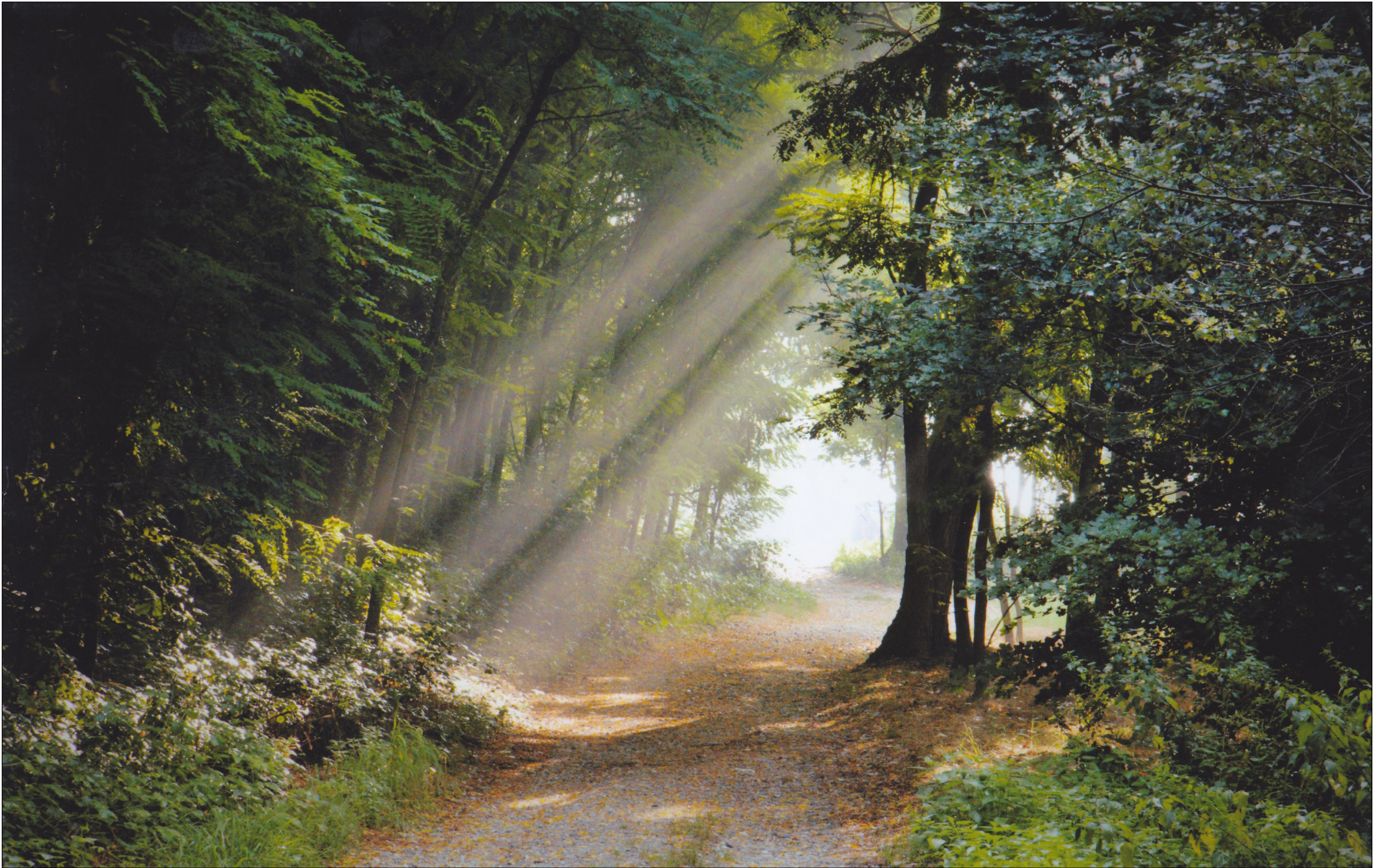
Concorso fotografico 2017 "PARCO SUD E DINTORNI: SCORCI E ANGOLI DI BELLEZZA", Michele Giorgio - I colori del bosco