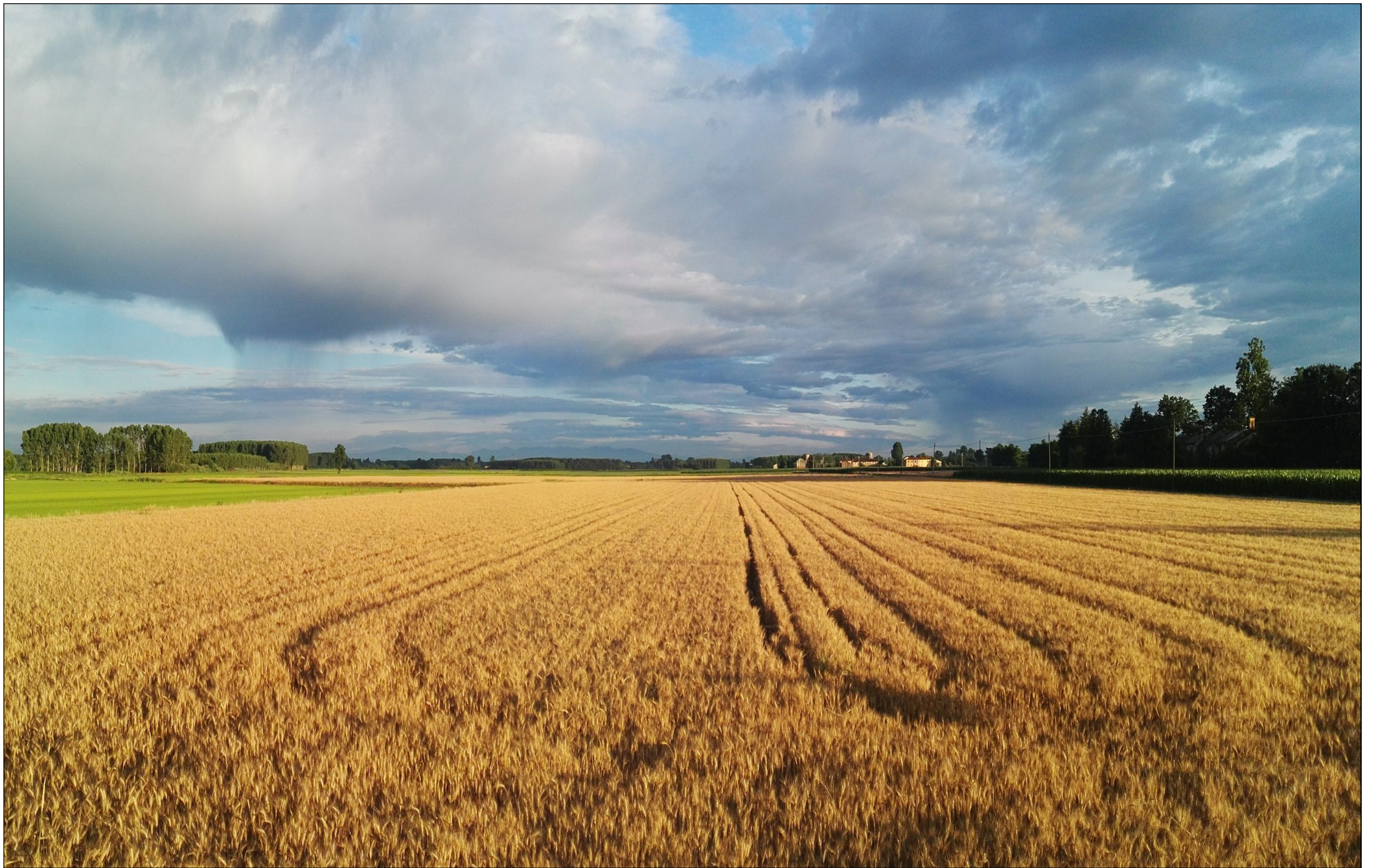
Concorso fotografico 2019 "I COLORI DEL PARCO SUD", Saverio Torcaso - Oro, nero, i colori della natura