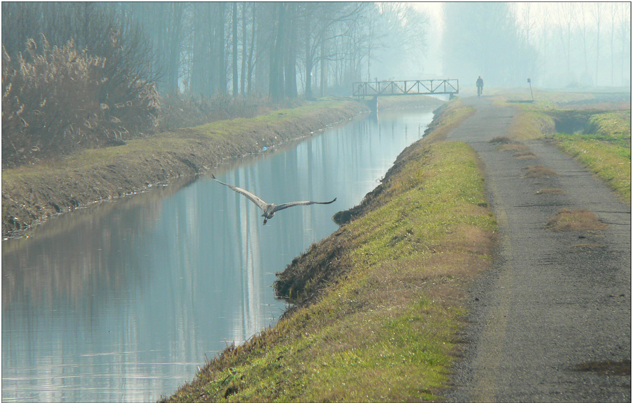
Concorso fotografico 2015 "I PERCORSI D'ACQUA, LA FLORA E LA FAUNA DEL PARCO SUD", Piero Capovilla - Volò