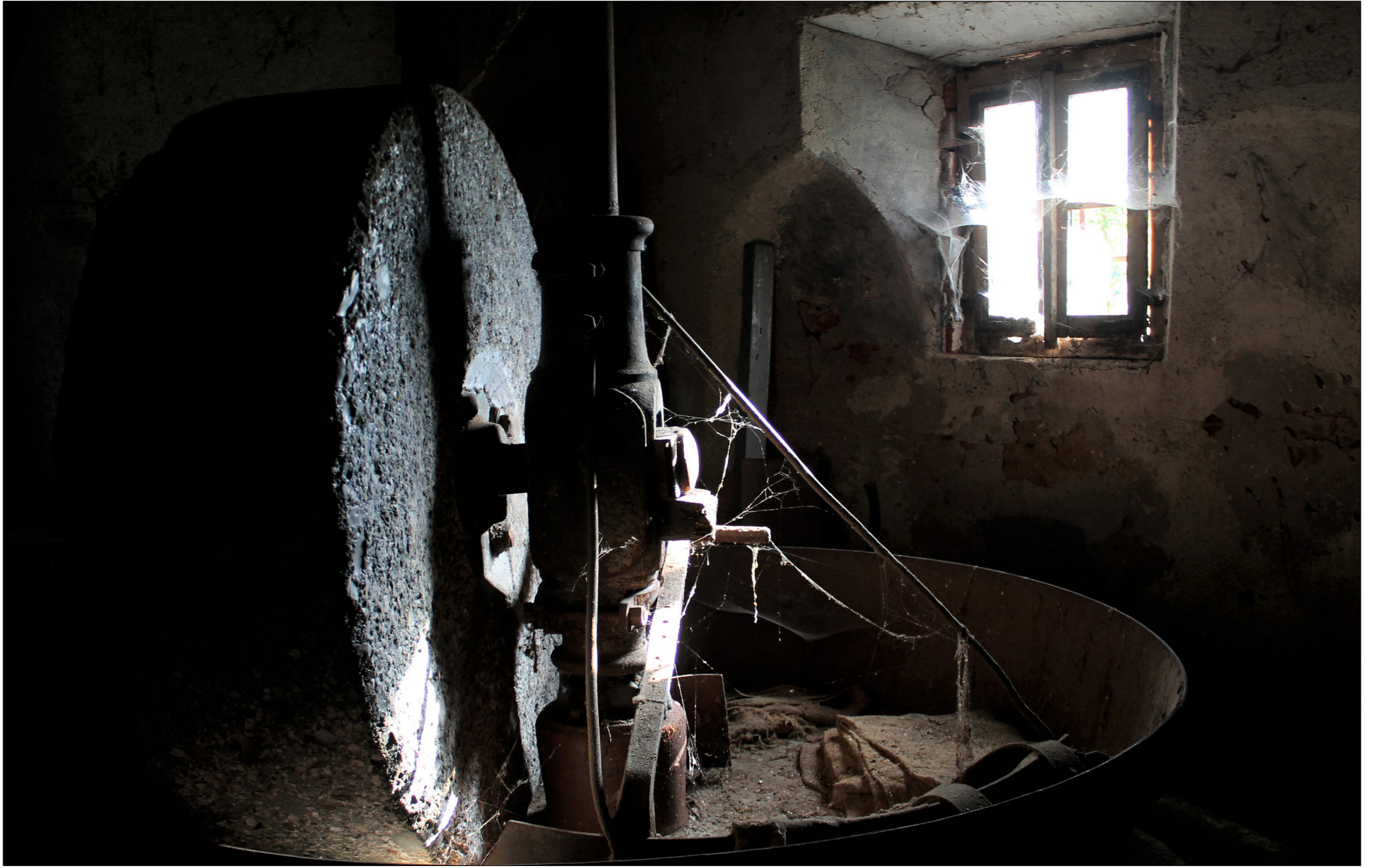
Concorso fotografico 2022 "MULINI NEL PARCO SUD", Giuseppe Bartorilla - Ad infinitum